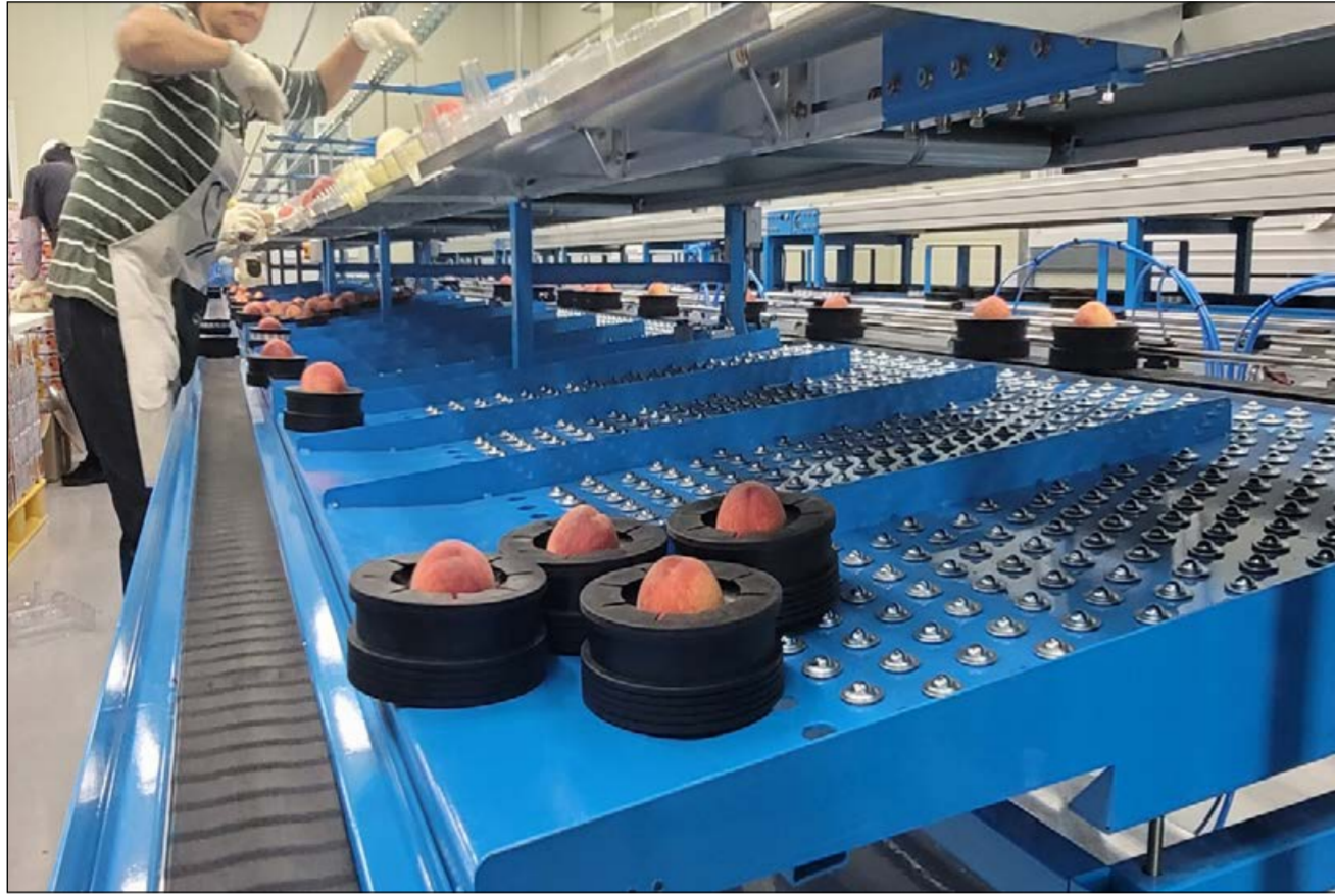
고흥군 농산물 스마트 공급센터에서 조생 복숭아가 자동화 선별 시스템을 통해 공동 선별되고 있다.