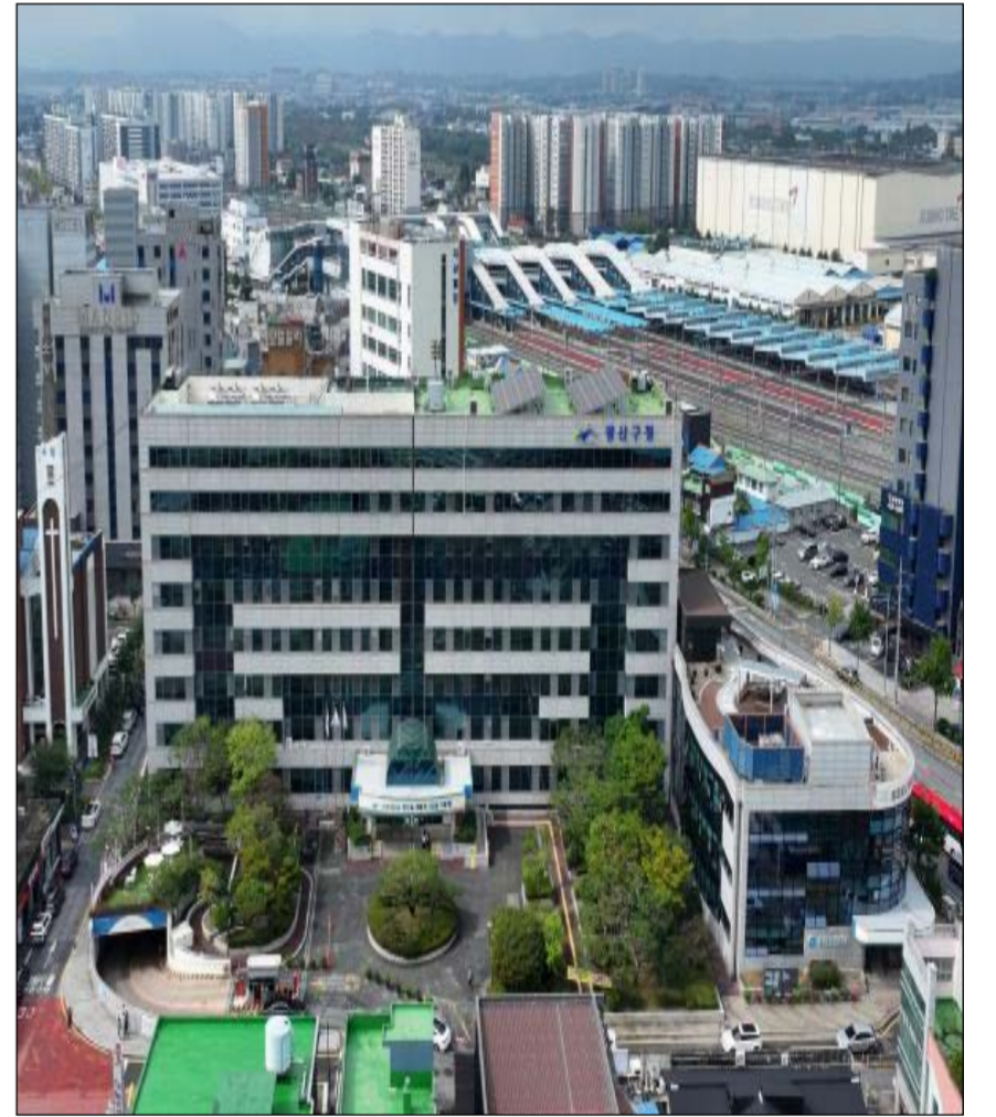
광주 광산구청 전경 사진

주민들의 건강 요구를 반영한 맞춤형 사업 운영도 건강 수준 향상에 긍정적인 영향을 미치고 있다는 평가를 받고 있다. 앞으로도 광산구는 생애주기별 건강관리 서비스를 확대하고 건강 취약계층 지원을 강화할 계획이다. 또한 주민 스스로 건강 문제를 해결할 수 있는 역량을 높여 건강한 공동체 조성에 나설 방침이다. /김정관 기자