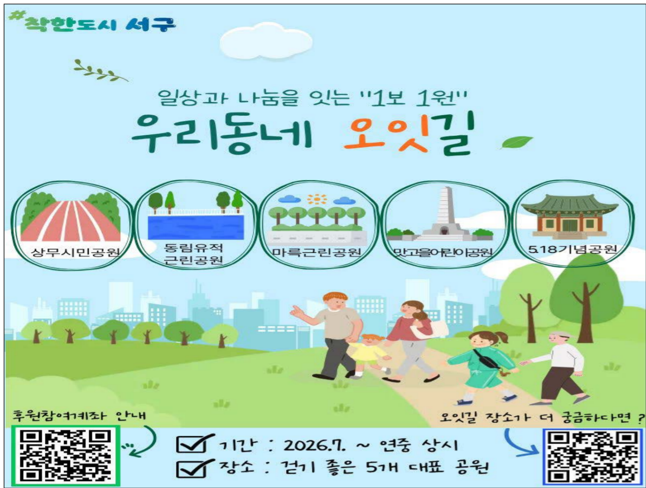
우리동네 오잇길 포스터