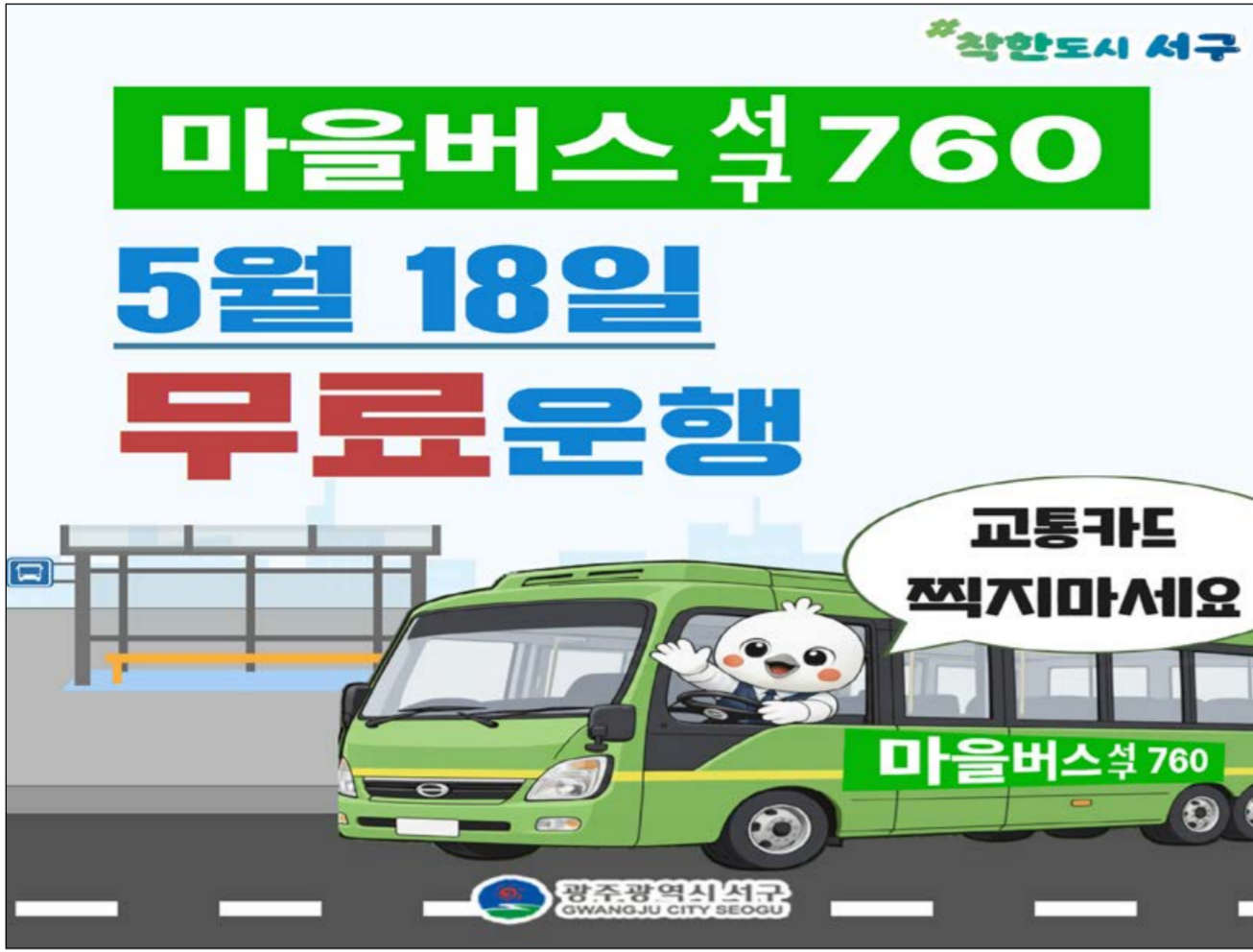
오는 18일 5·18 당일 마을버스 760번 무료 운행 포스터 사진