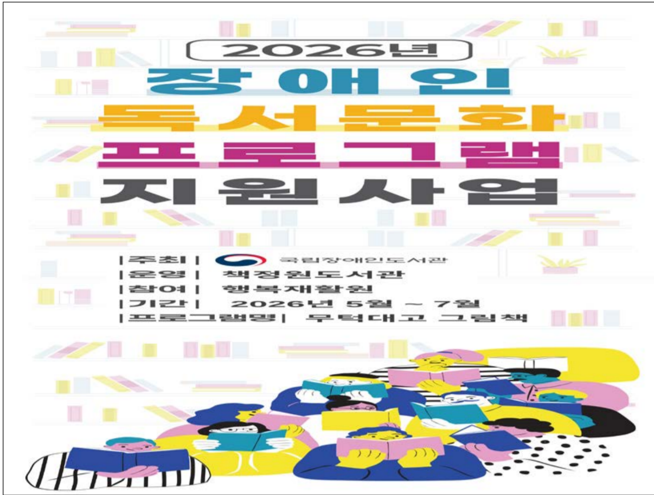
2026년 장애인 독서문화 프로그램 지원사업 포스터