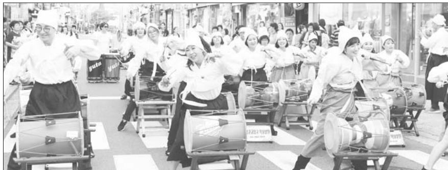
목포시가 '대한민국 관광거점도시'로 최종 선정됐다. 사진은 지난해 세계마당페스티벌 모습.

관광거점도시 선정으로 목포는 수산식품 수출단지 조성사업, 국가 에너지산업 융복합단지 지정에 이어 관광산업 육성까지 국가사업으로 추진하게 되면서 관광·수산식품·신재생 에너지로 설정한 3대 미래 전략사업 육성이 한층 더 탄력을 받을 것으로 기대된다.