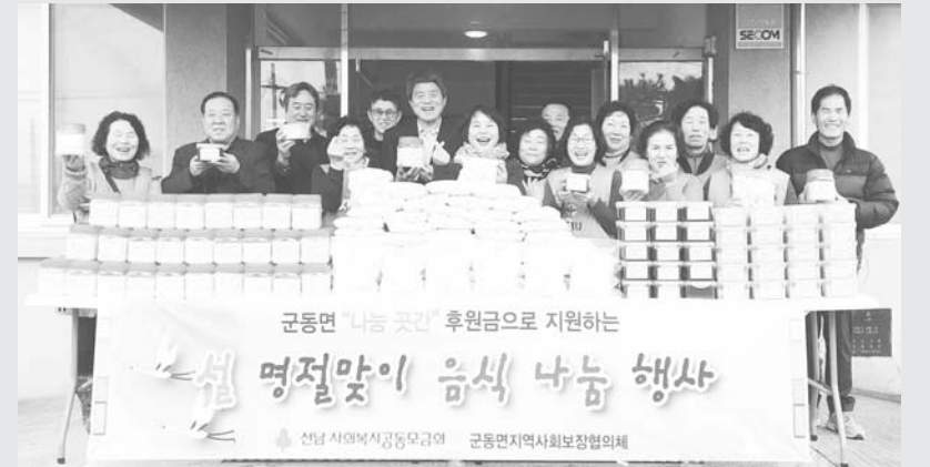
최근 강진군 군동면 지역사회보장협의체는 설을 맞아 홀로 명절을 지내는 독거노인, 청장년, 다문화 가정 등 100가정에 '설 명절음식 나눔 행사'로 따뜻한 온정의 손길을 내냈다.