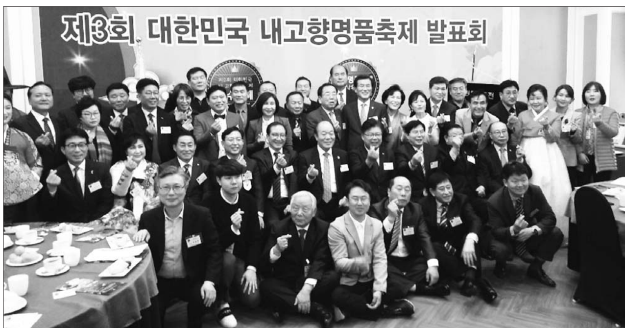
광양시는 제21회 광양매화축제가 최근 국회 본관 귀빈실에서 열린 '제3회 대한민국 내고향 명품축제'에서 18개 명품우수축제대상에 선정되는 쾌거를 이뤘다고 밝혔다.

광양시는 제21회 광양매화축제가 최근 국회 본관 귀빈실에서 열린 '제3회 대한민국 내고향 명품축제'에서 18개 명품우수축제대상에 선정되는 쾌거를 이뤘다고 밝혔다.