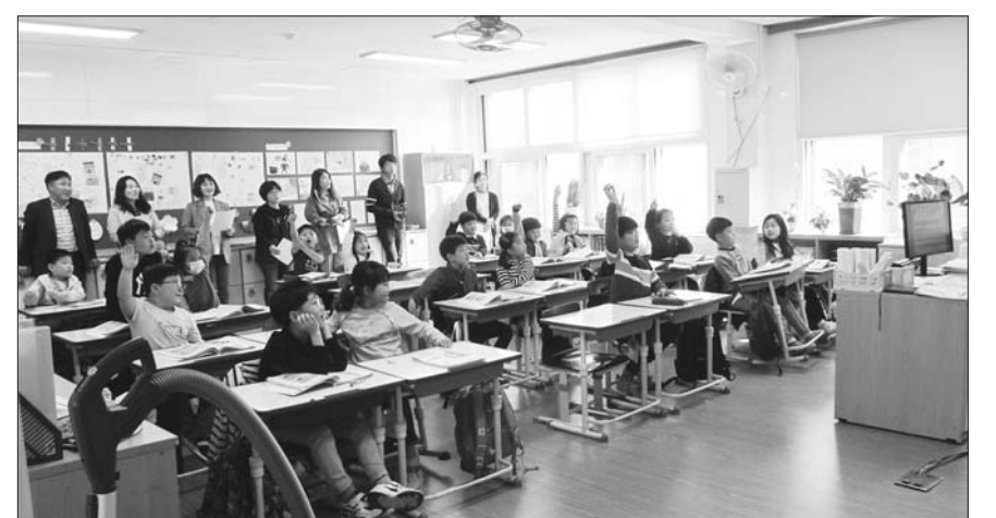
해남동초등학교, 학부모 초청 수업 공개 실시

광양백운중학교 학생 39명과 2명의 교원 등 41명이 최근 경남 통영으로 문학기행을 다녀왔다.