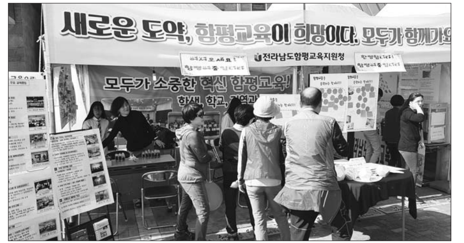
백만송이 국화향기와 함께 함평천지교육을 홍보하다

한편, 올해 대한민국 자치발전 대상 시상식은 오는 10월 30일 서울시 용산구에 위치한 백범 김구 기념관 컨벤션홀에서 개최될 예정이다. /순천=오승택 기자 ost6002@