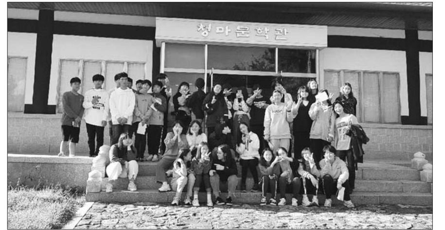
광양백운중학교, 통영으로 문학기행 떠나요

목포고등학교(교장 김갑수는)는 최근 목포교육지원청(교육장 김재점)이 주관한 '2019 목포교육 청·바지 프로젝트'에 함께 했다.