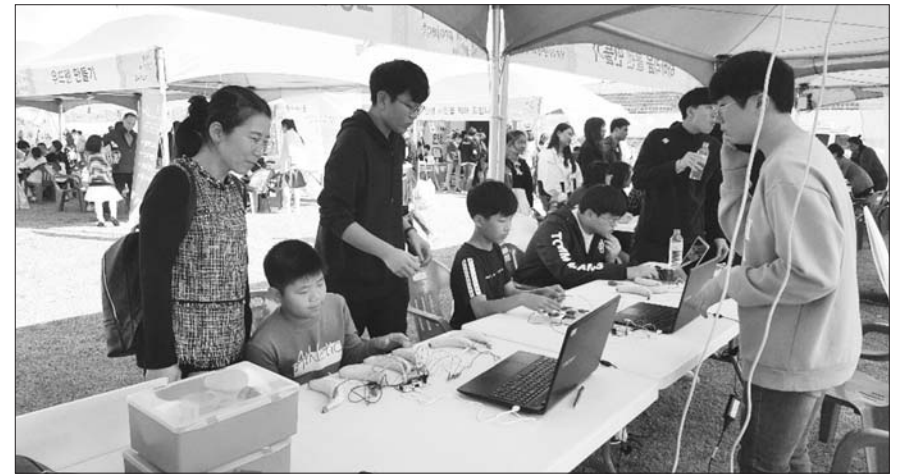
목포고등학교, 목포교육지원청 청·바지 프로젝트서 열정 부스 운영

함평교육지원청(교육장 박영숙)은 국향대전 축제기간 중 함평엑스포공원 일원에서 안심하고 아이를 키울 수 있는 함평혁신교육 홍보 부스를 운영하고 있다.