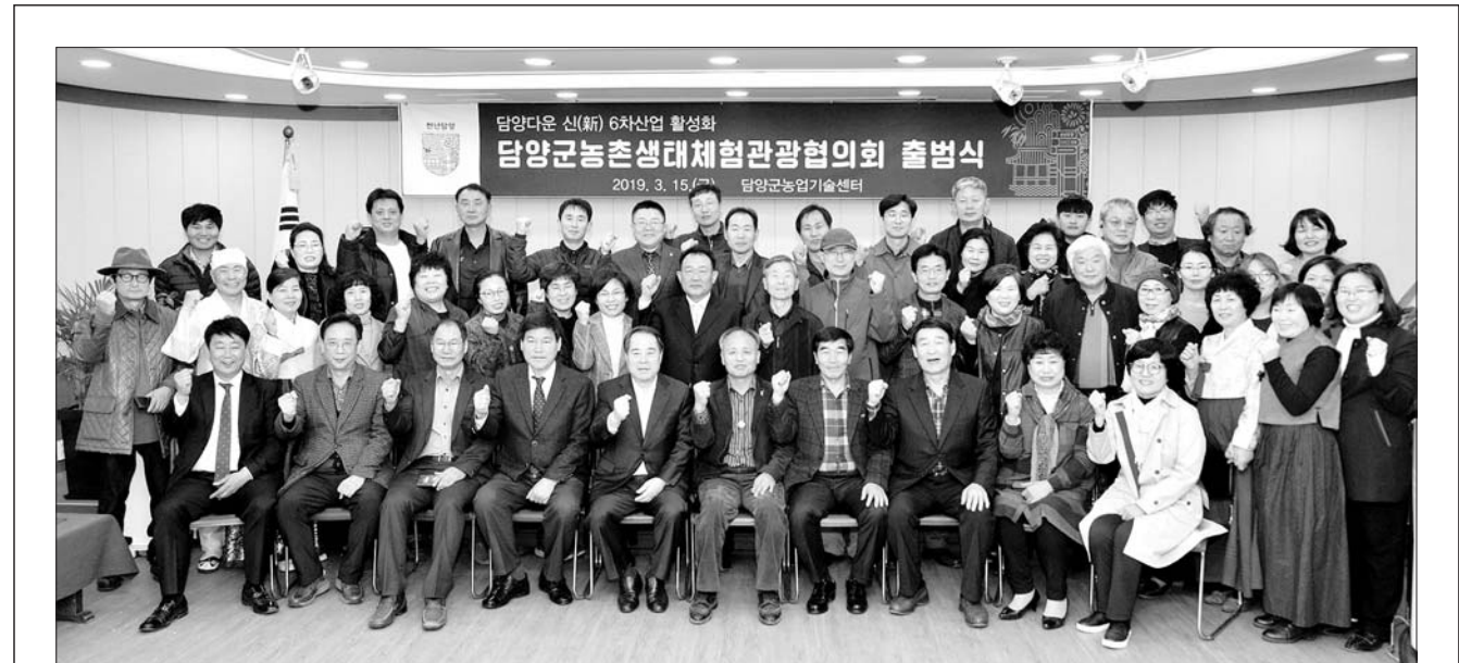
담양군은 최근 '담양군 농촌생태체험관광 협의회'의 출범식을 개최했다.