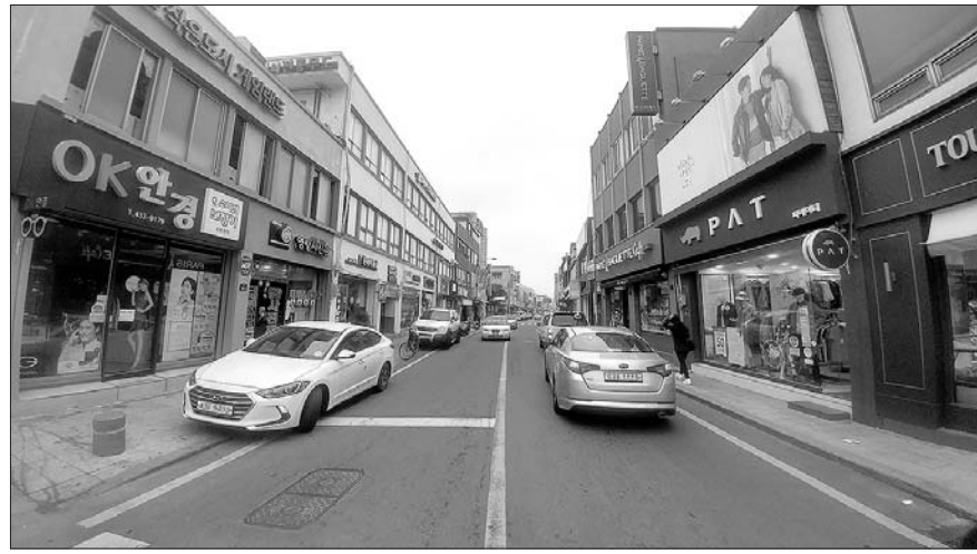
강진 중앙로상가 거리.

프로그램 운영 등이 진행된다. 강진군은 문화·관광형 시장으로 재도약을 위한 콘텐츠 개발 및 홍보 시스템 강화로 중앙로상가를 중심으로 한 지역경제 활성화에 더욱 박차를 가할 예정이다. 특히 이번 공모사업 선정은 지난해 추진했던 특성화 첫걸음시장 육성사업의 높은 성과와 일제강점기부터 형성됐다는 역사성, 주변 지역 문화자원과 연계성 등이 주효했다는 분석이다. 중앙로상가는 각종 교육 및 상인회의 자구적 노력으로 서비스 수준이 향상됐지만 고유의 볼거리, 즐길거리 등 차별화