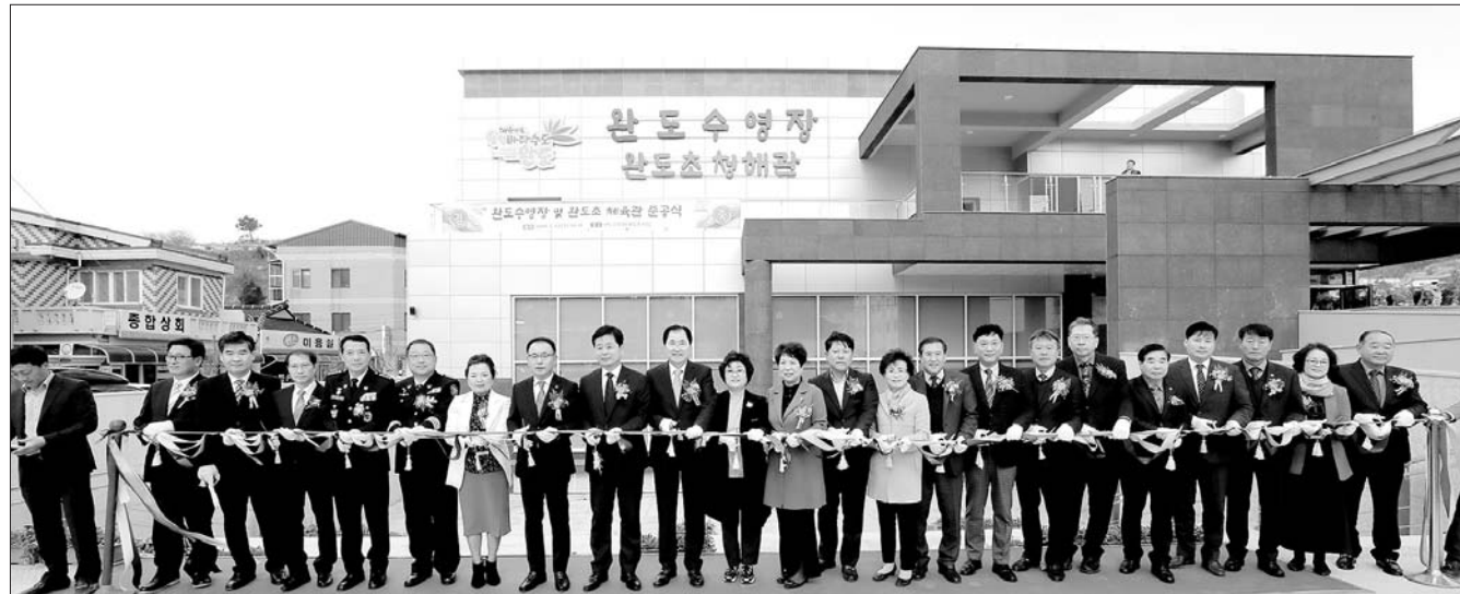
완도군은 지난 13일 완도군민의 생활 체육 증진과 건전한 여가 활동을 위해 건립된 완도수영장 준공식 및 다목적체육관 개관식을 가졌다. 완도수영장은 준공 이후 시험 가동을 통해 내달 2일 개방할 계획이다.

원 대비 880억 원(22.89%) 증가한 4천724억 원, 기타특별회계는 당초 78억 원 대비 2억 원(0.1%) 증가한 80억 원이며, 공기업특별회계는 본예산 332억 원 대비 94억 원(28.5%)이 증가한 426억 원을 편성했다. 기능별로는 사회복지 및 보건 분야 1천257억 원(24.03%), 농림해양수산 분야 1천171억 원(22.4%), 수송 및 교통, 국토지역개발 분야 715억 원(13.68%) 순으로 나타났다. /영암=김희선 기자 hskim@