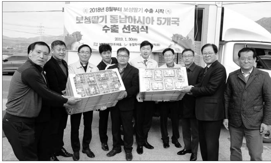
보성군은 최근 보성 딸기 동남아시아 5개국 수출 선적식을 가졌다.

국장은 “딸기를 해외로 수출하는 보성 농가들이 바로 애국자”라며 “보성 딸기가 앞으로 세계 시장에서 승승장구하기를 바란다”고 말했다. 한편, 보성군은 시설딸기(46ha) 농업으로 연간 53억 원의 농가 소득을 올리고 있으며, 딸기 축산재배 농가의 소득 향상을 위해 재배기술 지도를 지속적으로 추진하고 있다. 농업기술센터에서는 생산 시설 현대화를 위해 고설재배시스템 보급 이후 스마트팜 시스템, 행잉베드 시스템 도입 등 첨단 미래농업 기반을 구축해 농업 경쟁력 향상을 위해 발 빠르게 움직이고 있다. /보성=김용욱 기자 ywkim@