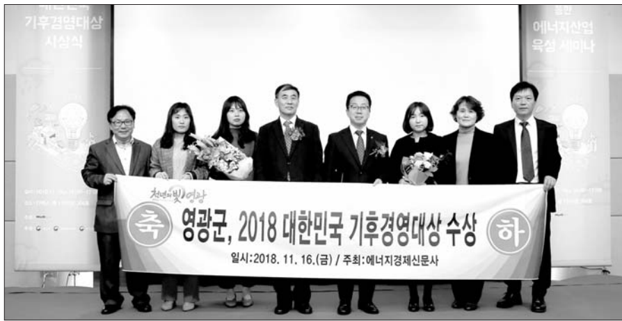
최근 영광군이 에너지경제신문에서 주최하는 '2018 대한민국 기후경영대상' 외교부장관상을 수상했다.

에너지 3020 이행계획'을 성공적으로 이행하는 데 크게 기여했다. 특히, 재생에너지 개발 주변 지역 주민과의 갈등을 줄이고 친 신재생에너지 분위기 정착을 위해 발전소 주변지역 지원사업의 일환으로 주민 소득 증대를 위한 시설사업과 상하수 주민 복지센터 리모델링, 농로포장 등 공공복지 사업을 지원함으로써 신재생에너지 보급에 가시적인 성과를 거두었다는 평가를 받으며 외교부장관상을 수상했다.