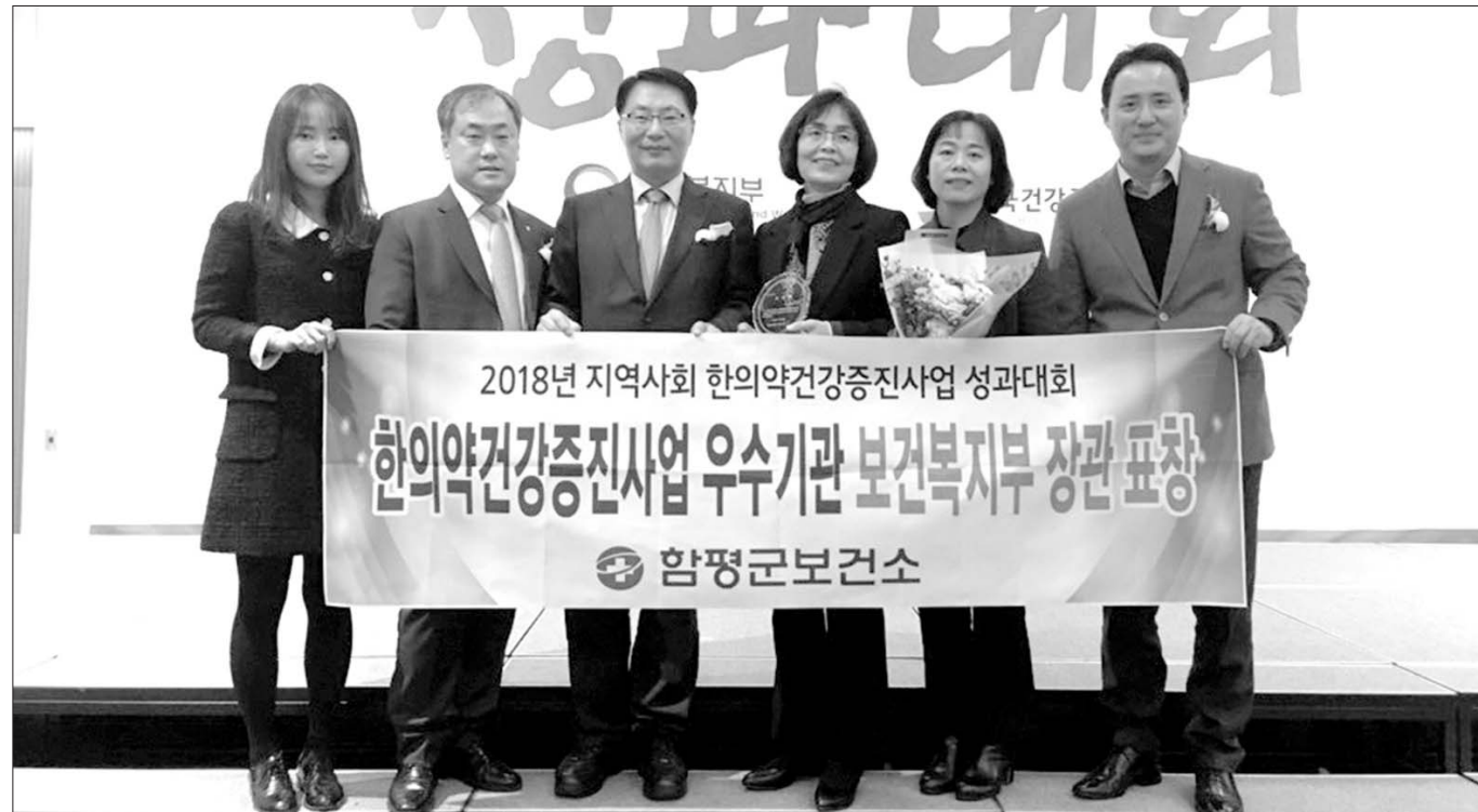
함평군보건소가 최근 보건복지부와 한국건강증진개발원이 공동으로 주관한 '2018 한의약건강증진사업 성과대회'에서 우수기관으로 선정돼 보건복지부장관 기관표창을 수상했다.

장성군보건소는 최근부터 금연구역도원 4명과 함께 2개 조로 단속반을 편성해 주간은 물론 야간과 주말에도 금연 지도 및 단속을 실시한다. 이번 단속의 중점 점검 대상은 민원이 주로 발생하는 버스터미널, PC방, 당구장 등의 공중이용시설이다. 주요 점검사항은 금연구역 표지판 또는 스티커 부착 여부, 금연구역 내 흡연실 설치 기준 준수 여부, 당구장 등 실내체육시설의 금연구역 준수 여부 등이며, 금연구역으로 지정된 공중이용시설 내 흡연행위도 단속 대상이다.